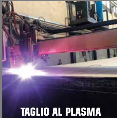
TAGLIO AL PLASMA